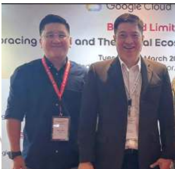
Bersama CEO VERIHUBS yang mengembangkan AI pengenalan wajah untuk verifikasi industri keuangan

Indosat Ooredoo Hutchison (Indosat atau IOH), melalui Indosat Digital Ecosystem (IDE) by Indosat Business, berkolaborasi dengan Google Cloud Indonesia untuk mendukung pemberdayaan bisnis rintisan atau startup.