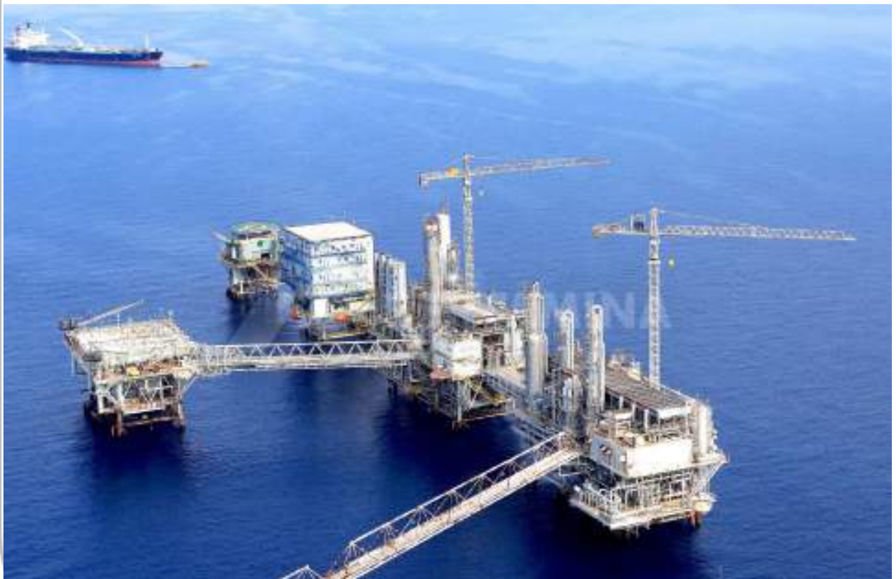
Anjungan PHE ONWJ

Saat ini PHE menjajaki tiga bisnis baru yakni pengeboran "deep water", carbon captured storage (CCS), dan "geologic hydrogen". PHE juga akan melaksanakan survei seismik di Wilayah Kerja (WK) East Natuna pada tahun ini.