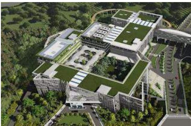
Sketsa proyek kantor Kementerian PUPR