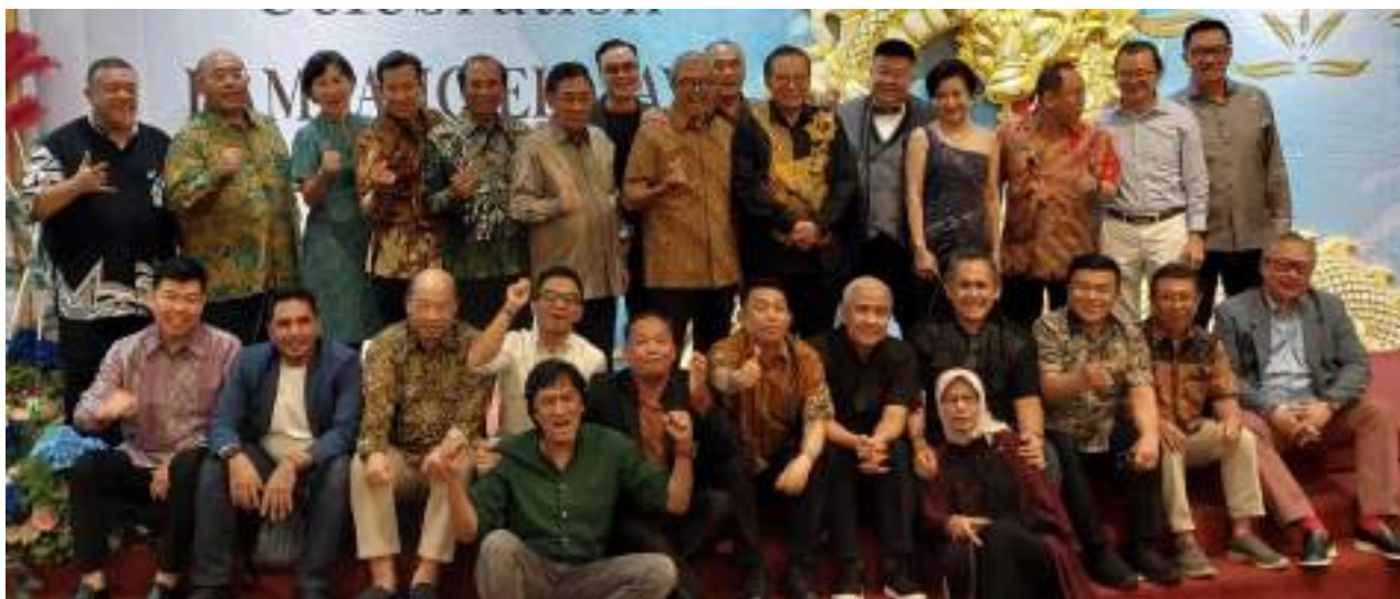
Jajaran Pengurus REI Pusat dan Daerah