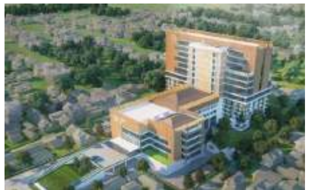
Sketsa proyek RS Kasih Ibu Bengawan