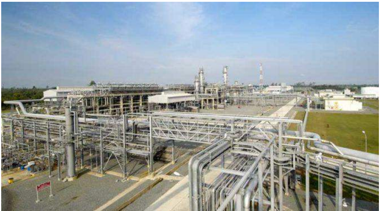
Salah satu lokasi fasilitas pengelolaan minyak dan gas PetroChina Jabung

Pemboran eksplorasi ini dimaksudkan untuk menguji dan mengevaluasi potensi kandungan migas pada batuan dasar (basement) lapangan Northeast Betara