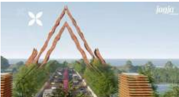
Sketsa proyek jembatan Pandansimo