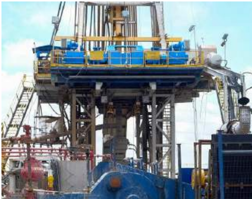
Rig (alat pengebor) elektrik D-1500E di operasi pengeboran sumur JST-A2 Pertamina EP Asset 3, Desa kalentambo, Pusakanagara, Subang, Jawa Barat

Sementara PT Pertamina EP (PEP) Sangatta Field berhasil mencatatkan tingkat produksi minyak tertinggi dengan menghasilkan sebesar 3.545 BOPD (barrel of oil per day atau barel minyak per hari) pada 24 Maret 2024 lalu. Jumlah produksi ini merupakan yang tertinggi sejak 1987