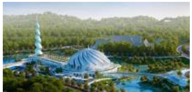
Sketsa proyek Masjid Negara