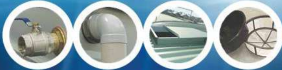
Bottom Outlet/Ball Valve Overflow Pipe Access Hatch 370mm LeafBasket