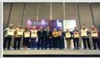
Memberikan series Innovation Award kepada perusahaan EV Ecosystem Industry