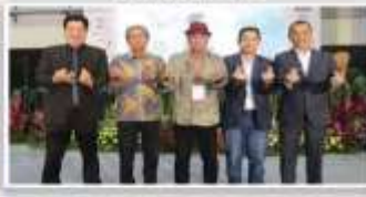
Sharing Inovasi Proyek Properti Ciputra Development Group & Cikarang Int'l City