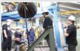
Liputan TENDER TV Pabrik Pompa Migas Bukaka Teknik Utama Tbk