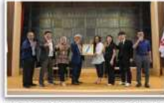
Indonesia - China Innovation & Technology Collaboration for Chemical Industry (Bersama BRIN, Kemenperin, SSA Shanghai Society of Advance Material & CHEF Chemical Tech Expo Fair