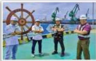
Kunjungan ke Krakatau Port International Cilegon