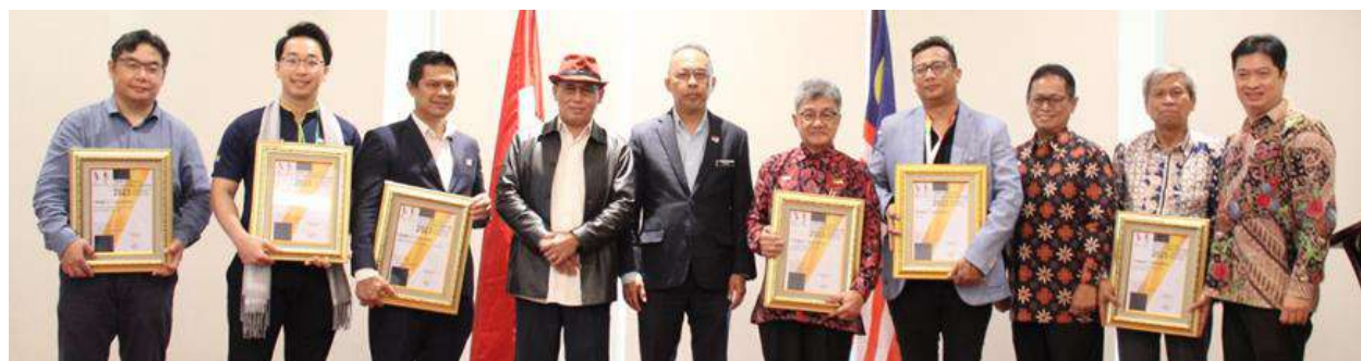
Perwakilan anggota hub dari Malaysia dan Indonesia menerima sertifikat.