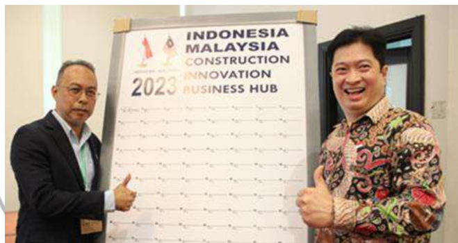
Wall of fame CIDB Malaysia