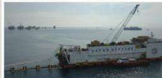
Kapal FLS Hafar Neptune milik Hafar Daya Konstruksi sedang berlayar di proyek offshore...

sudah lebih 100 tahun di Nusantara. Saat ini ada beberapa perusahaan EPC nasional yang mumpuni, bahkan memiliki armada kapal kerja offshore sendiri, belum saja semisal Timas Sugilindo yang memiliki dua kapal, Menda Elang Indah, dan Hafar Daya Konstruksi