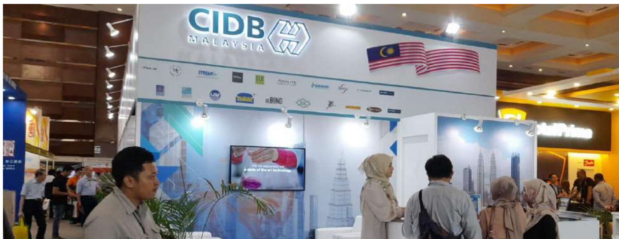
Paviliun CIDB Malaysia di Pameran IEE Engineering Series 2023

Penyelenggaraan IEE Series 2023 menghadirkan 70 negara dan lebih dari 2,100 perusahaan, dan berbagai sektor industri turut serta hadir dengan total trade attendees mencapai 47,701. Salah satu Negara yang membawa banyak Perusahaan sebagai exhibitor dan memiliki pavilion khusus adalah Negari Jiran melalui CIDB Malaysia.