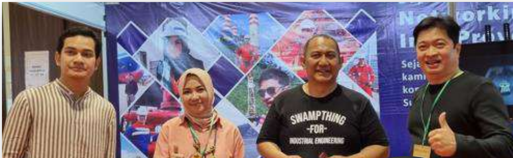
Bersama VP Aset PT PLN (Persero)

Informasi proyek dan networking yang ada di Booth Tender Indonesia pada Pameran IEE 2023 ramai dikunjungi visitor dari berbagai latar belakang industri. Termasuk kedatangan berbagai tamu VIP: