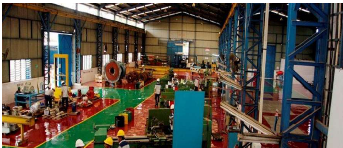
Kabar dari Member Tender Indonesia

PT. Guna Pertiwi Cemerlang was incorporated in Jakarta in 1989. It was mainly dealing with centrifugal process pumps & manual valves only.