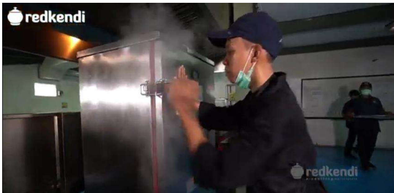
Kabar dari Member Tender Indonesia

PT Sinergi Mitrajaya Abadi (SMJA) is a leading manpower supplier to the oil, gas and mining sector (OMG Sector) providing highly skilled labor for on-shore and off-shore operations, in addition to a full range of catering and accomodation services.