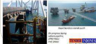
Kapal bendera merah jitu

Oh progress banget nih... Menda Elang Indah PRO-NGL PHE OWI