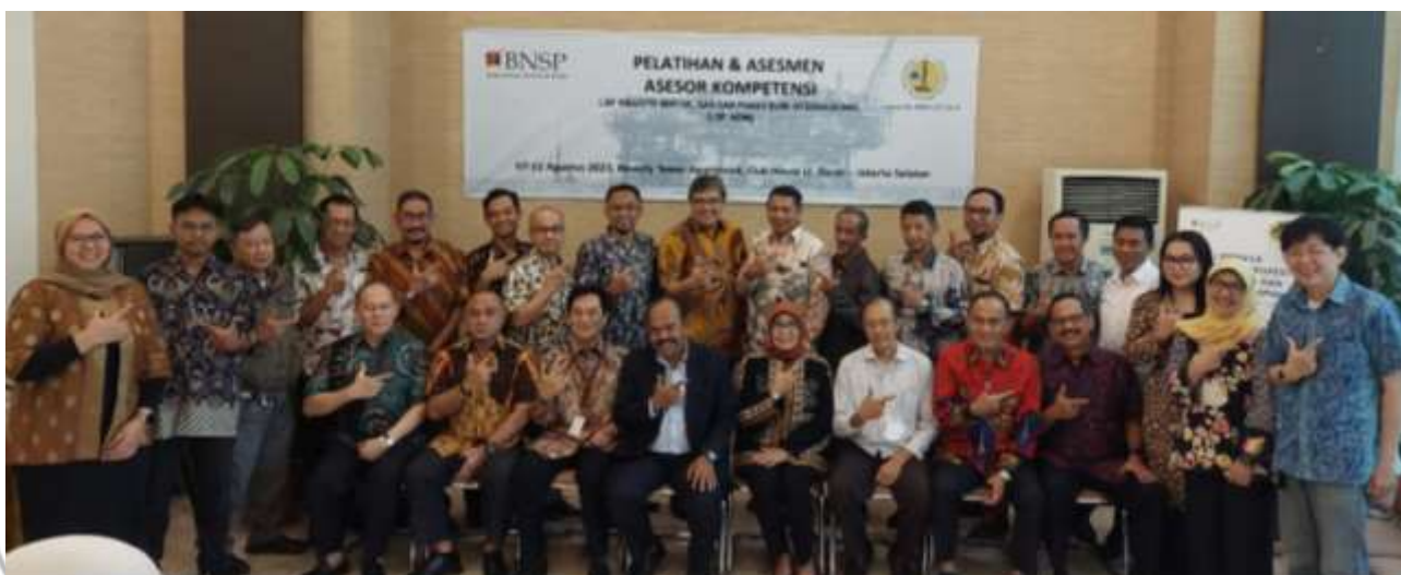
Para peserta pelatihan dan assesmen kompetensi APMI 2023

Ini untuk membantu penciptaan insan kerja hulu migas yang cakap bekerja sehingga target produksi selaras dengan keselamatan kerja. Bersama BNSP maka telah sukses dilakukan pelatihan asesor selama seminggu penuh.