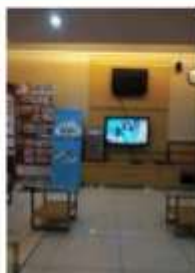
Television, HP Charging Port