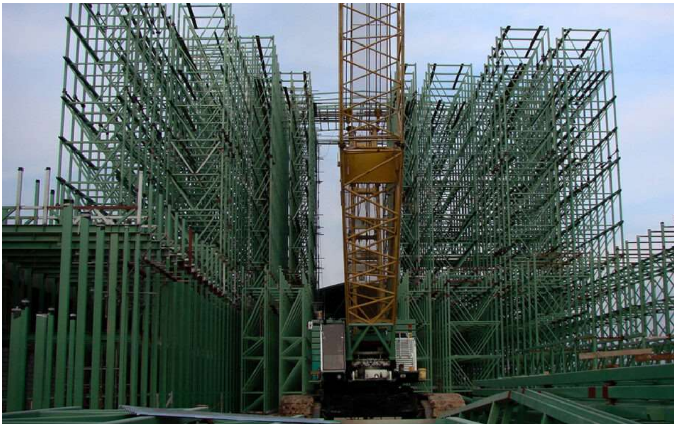
Kabar dari Member Tender Indonesia

PT Mitra Sarana Membangun is a Construction Engineering Company that serve various strategic partners for Civil and Construction projects with main focus in Industrial Plant, Building & Property, and Infrastructures. Our business philosophy is to deliver commitment of quality, for both clients and internal stakeholders.