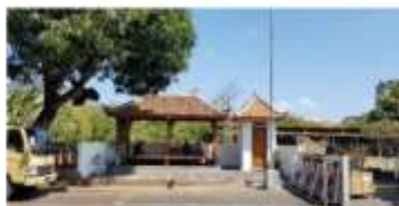
Drivers Waiting Area (pendopo)