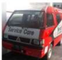
HSK (Home Service Kit)