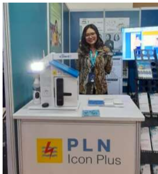
Booth PLN Icon Plus

6. Drone: Tren penggunaan drone dalam berbagai sektor di masa depan semakin kuat.