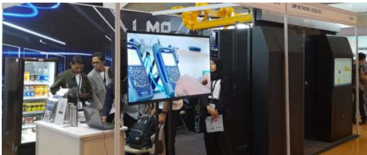
Booth Stand sebuah perusahaan Data Centre di Pameran INTI 2023

Kemajuan teknologi ICT adalah keniscayaan. Berikut 6 parameter tren teknologinya :