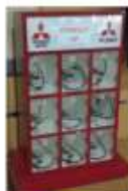
HP Charging Port