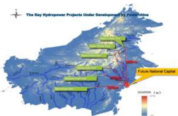
Proyek Mega HYDRO POWER Kalimantan