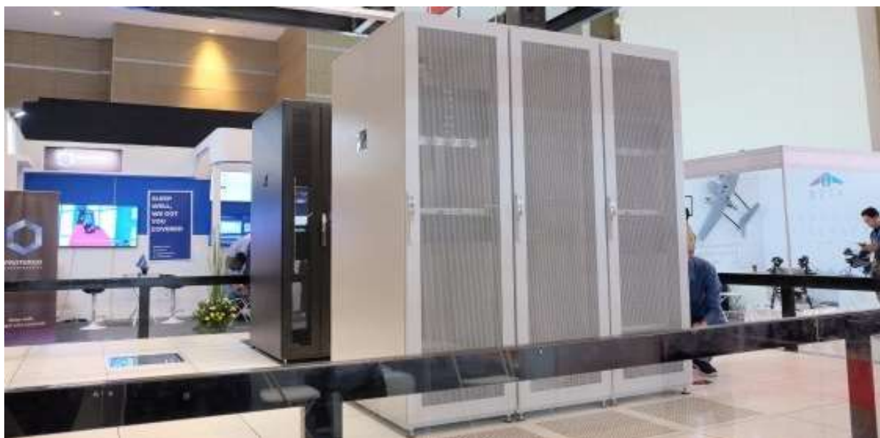
Booth stand Perusahaan Data Centre