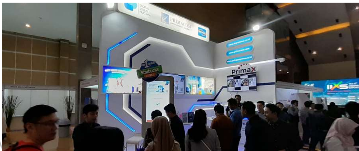
Keramaian di Booth Primacom

Dari hulu hingga hilir, keberagaman sektor industri tercermin dalam kehadiran para peserta. Menariknya, lebih dari 10.652 peserta tercatat hadir dalam acara ini. INTI-2023 berhasil mengambil peran penting dalam merangkum isu-isu teknologi yang akan membentuk lima tahun mendatang.