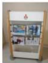
News Paper, Magazines