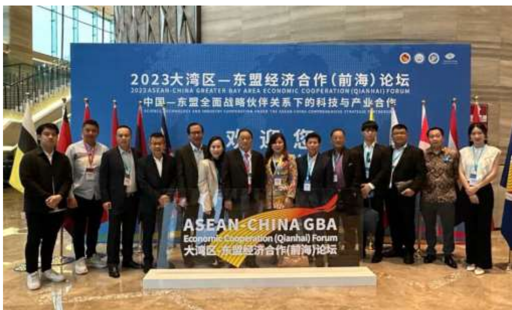
Perhimpunan INTI bersama Deputi Bidang Promosi Penanaman Modal Kementerian Investasi/BKPM bapak Nurul Ichwan dan tim menghadiri The 2023 ASEAN-China Greater Bay Area (Qianhai) Economic Cooperation Forum di Hotel JW Marriott Shenzhen Bao'an, China