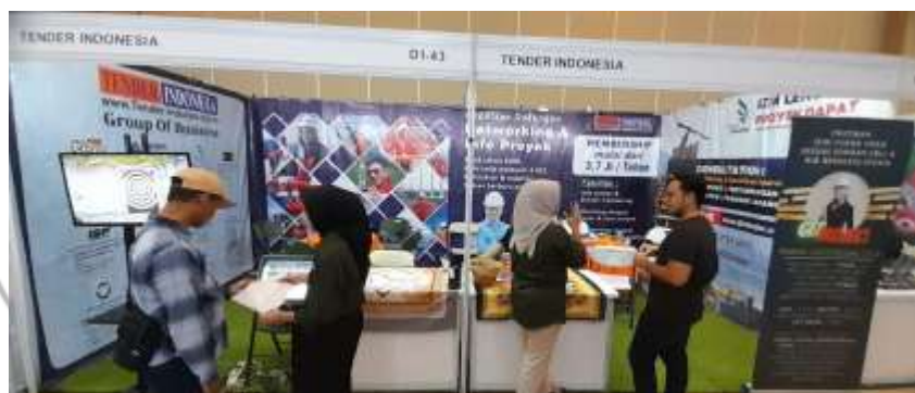
Booth Tender Indonesia