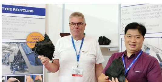
Teknologi ELDAN untuk recycle waste tire (limbah ban bekas kendaraan) menjadi aneka produk