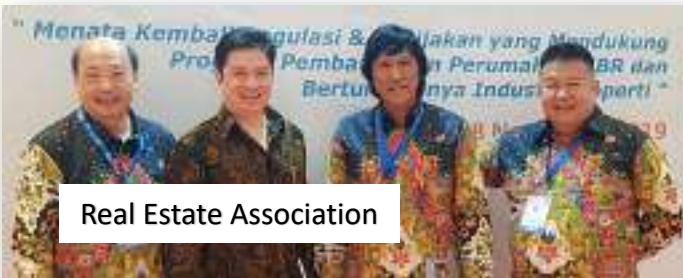
Real Estate Association