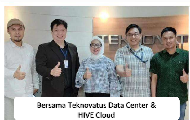
Bersama Teknovatus Data Center & HIVE Cloud