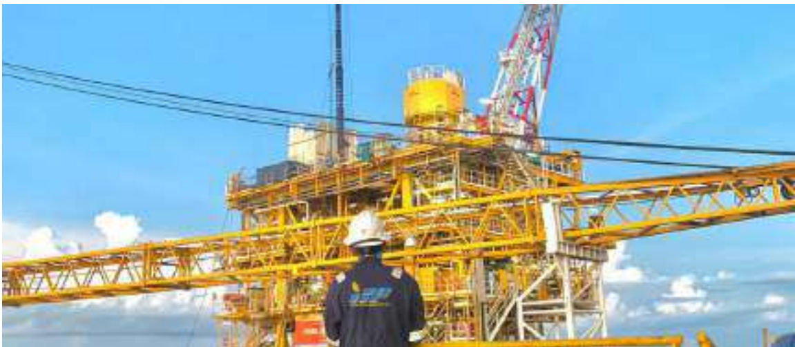
Kabar dari Member Tender Indonesia

PT Inspektindo Sinergi Persada complies to local content requirement with more than 90% local component and in 2014 become "Perusahaan Inspeksi" (PI) appointed legally by SKK MIGAS - Ministry of Energy and Mineral Resources.