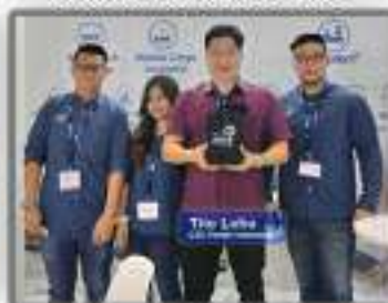
Bersama Asuransi ASTRA BUANA untuk asuransi proyek