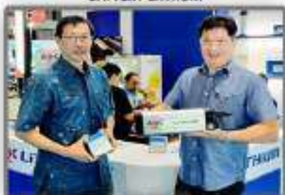
Bersama Hermawan ABC Lithium Battery