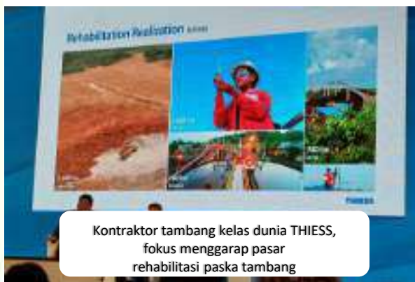
Kontraktor tambang kelas dunia THIESS, fokus menggarap pasar rehabilitasi paska tambang