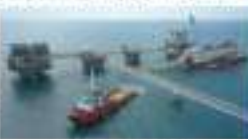
Kapal Selva sja service

(In english only) selva sja service, 1790-8611, 792-0947