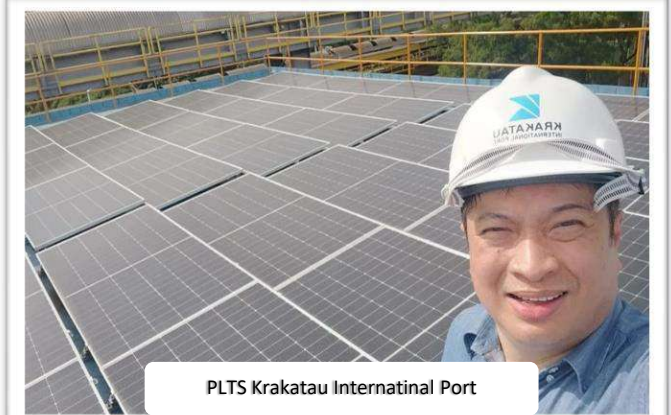
PLTS Krakatau International Port