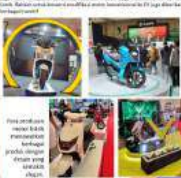
SMB juga ada dalam koalisi yang berfokus untuk mengembangkan teknologi baterai untuk kendaraan listrik (EV) yang akan membantu dalam meningkatkan efisiensi energi.

TENDER INDONESIA www.Tender-Indonesia.com