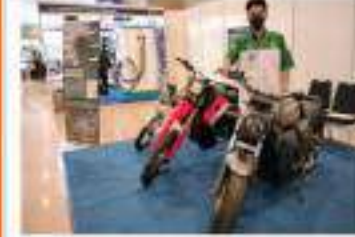
Motok besar modifikasi yang dimodifikasi jadi motor listrik

"Melalui program ini, kami berharap dapat meningkatkan efisiensi energi dan mengurangi emisi karbon. Program ini bertujuan untuk meningkatkan efisiensi energi dan mengurangi emisi karbon."