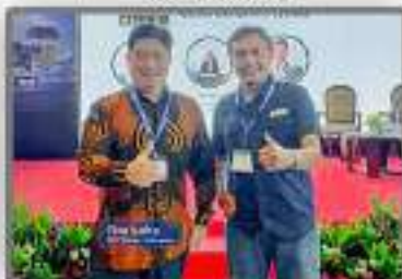
Bersama Michael APNI (Asosiasi Penambang Nikel Indonesia)