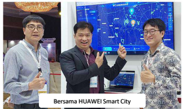
Bersama HUAWEI Smart City