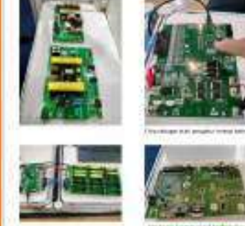
Penelitian dan pengembangan sistem baterai

Program ini bertujuan untuk meningkatkan efisiensi energi dan mengurangi emisi karbon. Program ini bertujuan untuk meningkatkan efisiensi energi dan mengurangi emisi karbon.