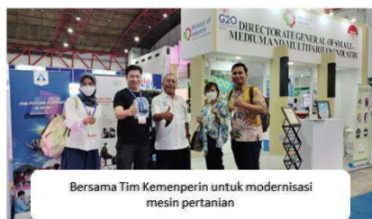
Bersama Tim Kemenperin untuk modernisasi mesin pertanian