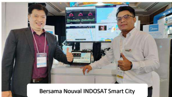
Bersama Nouval INDOSAT Smart City