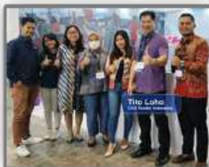
Bersama Manajemen Silokbar dan Oil Spill Response Team