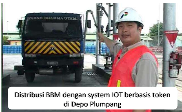
Distribusi BBM dengan system IOT berbasis token di Depo Plumpang

Mencakup lima proyek peningkatan kapasitas kilang eksisting (Refinery Development Master Plan/RDMP) dan satu kilang (Grass Root Refinery/GRR) diperkirakan US$ 43 miliar.