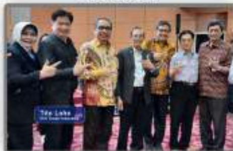
Pengurus LSP APMI (Asosiasi Perusahaan Pembaruan Migas & Panas Bumi Indonesia) bersama BNSP