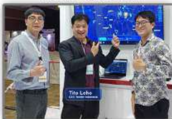
Bersama HUAWEI Smart City