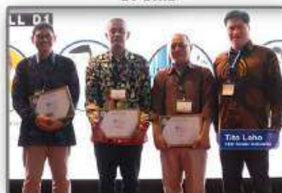
Bersama KOSMIK (Komunitas Motor Listrik Indonesia)