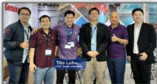
Bersama Manajemen Pioneer (Yanmar)