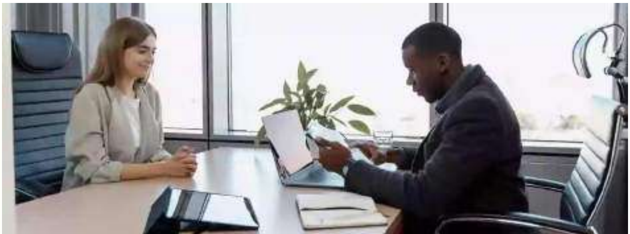
Kabar dari Member Tender Indonesia

PT Borneo Citra Megah Indonesia highly skilled and experienced recruitment consultants with established track records of delivering the right candidates, on time. Our extensive recruitment expertise and global reach means we leave nothing to chance when developing recruitment strategies and plans for your organization and sourcing the best candidates.