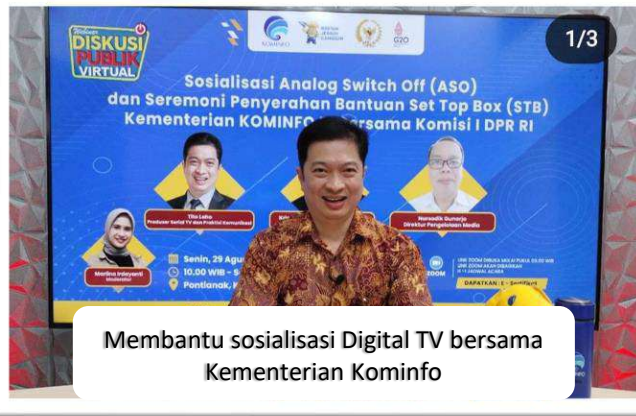
Membantu sosialisasi Digital TV bersama Kementerian Kominfo