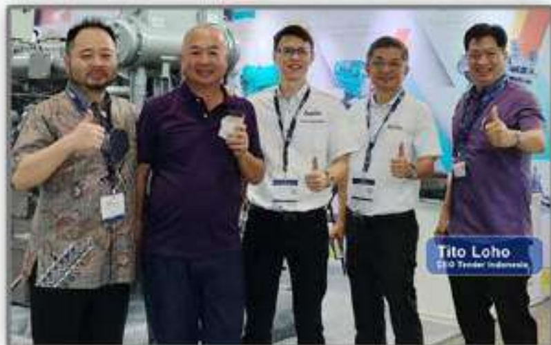
Bersama Manajemen APOLLO Marine Engine dan Sunny Paint