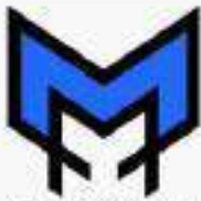
PT. MASELO MAJU HARAPAN MASELO MAJU HARAPAN