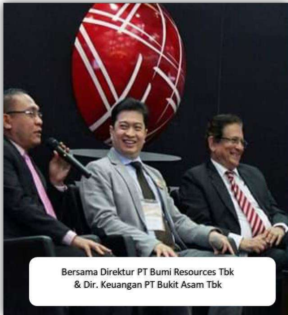
Bersama Direktur PT Bumi Resources Tbk & Dir. Keuangan PT Bukit Asam Tbk