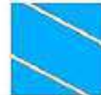
PT. SARANDI KARYA NUGRAHA SARANDI KARYA NUGRAHA