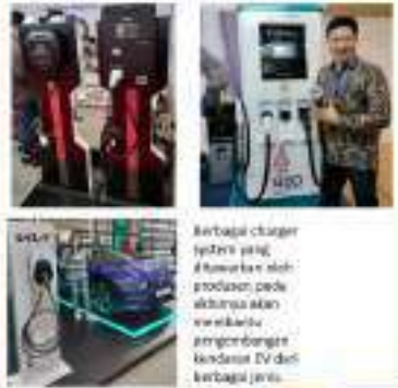
Berbagai charger system yang akan membantu meningkatkan daya tahan baterai untuk kendaraan listrik yang semakin banyak.

Hal ini akan membantu meningkatkan daya tahan baterai untuk kendaraan listrik yang semakin banyak. Selain itu, baterai EV ini juga dapat digunakan untuk berbagai aplikasi yang berbeda-beda.