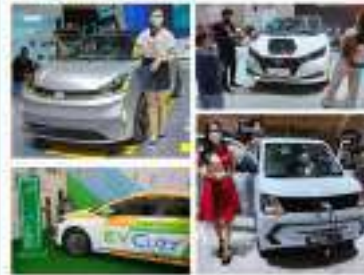
SMB juga ada dalam koalisi yang berfokus untuk mengembangkan teknologi baterai untuk kendaraan listrik (EV) yang akan membantu dalam meningkatkan efisiensi energi.

TENDER INDONESIA www.Tender-Indonesia.com