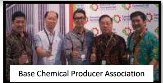
Base Chemical Producer Association