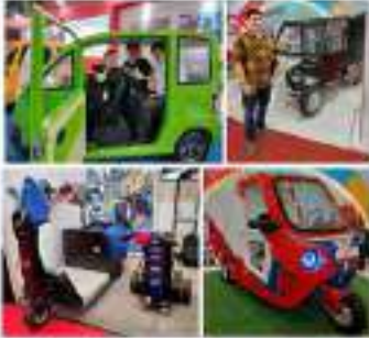
Berbagai varian EV berbasis AI

Sebagai upaya untuk mendukung inovasi teknologi yang ramah lingkungan, pemerintah Jawa Tengah telah meluncurkan program EV berbasis AI yang mengintegrasikan kecerdasan buatan ke dalam sistem kontrol kendaraan. Program ini bertujuan untuk meningkatkan efisiensi energi dan mengurangi emisi karbon.