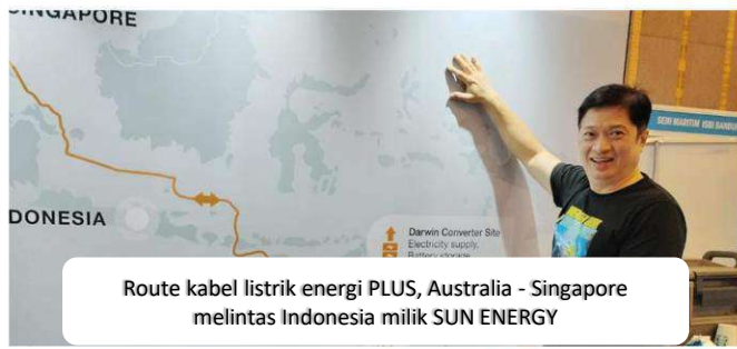
Route kabel listrik energi PLUS, Australia - Singapore melintas Indonesia milik SUN ENERGY