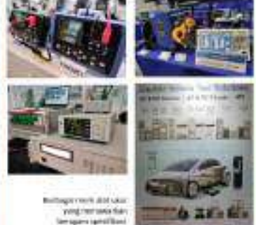
SMB juga ada dalam koalisi yang berfokus untuk mengembangkan teknologi baterai untuk kendaraan listrik (EV) yang akan membantu dalam meningkatkan efisiensi energi.

TENDER INDONESIA www.Tender-Indonesia.com