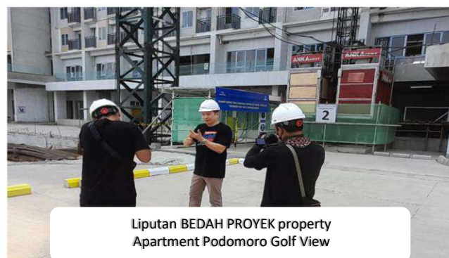
Liputan BEDAH PROYEK property Apartment Podomoro Golf View