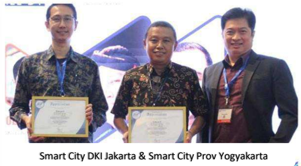
Smart City DKI Jakarta & Smart City Prov Yogyakarta