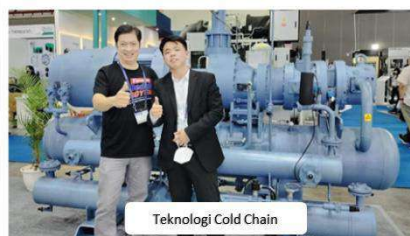
Teknologi Cold Chain