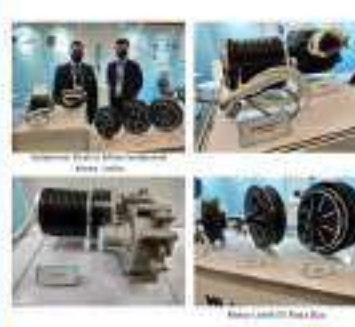
Salah satu produk EV

Program ini bertujuan untuk meningkatkan efisiensi energi dan mengurangi emisi karbon. Program ini bertujuan untuk meningkatkan efisiensi energi dan mengurangi emisi karbon.