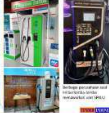
Berbagai perusahaan saat ini berfokus untuk meningkatkan nilai SPKLU

Implementasi EV dapat berkontribusi pada pengurangan emisi karbon, yang merupakan salah satu prioritas nasional. Dengan menggunakan energi terbarukan, sistem tenaga listrik dapat menjadi lebih ramah lingkungan.