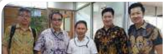
Electronics Manufacturer Association