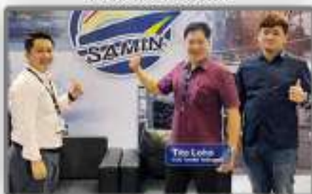
Bersama Setawak Shipyard Association