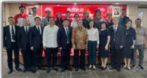
Menyambut delegasi Hunan Federation Overseas Chinese SUSTAINABLE CITY PROJECT