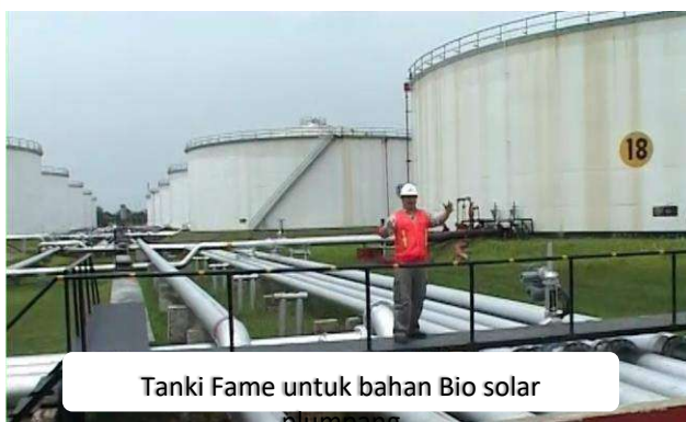
Tanki Fame untuk bahan Bio solar plumpang