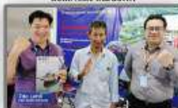
Bersama Dock One Rina (Shipyard & Designing Contractor)