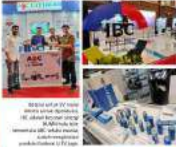
SMB juga ada dalam koalisi yang berfokus untuk mengembangkan teknologi baterai untuk kendaraan listrik (EV) yang akan membantu dalam meningkatkan efisiensi energi.

TENDER INDONESIA www.Tender-Indonesia.com