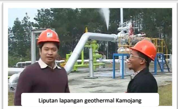
Liputan lapangan geothermal Kamojang