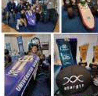
Berbagai kegiatan riset dan akademik untuk EV listrik, baik per

Program ini bertujuan untuk meningkatkan efisiensi energi dan mengurangi emisi karbon. Program ini bertujuan untuk meningkatkan efisiensi energi dan mengurangi emisi karbon.