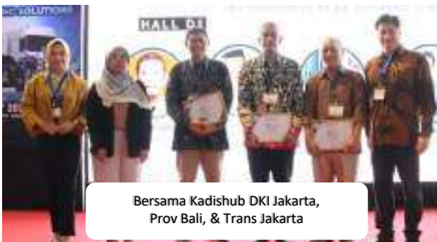
Bersama Kadishub DKI Jakarta, Prov Bali, & Trans Jakarta