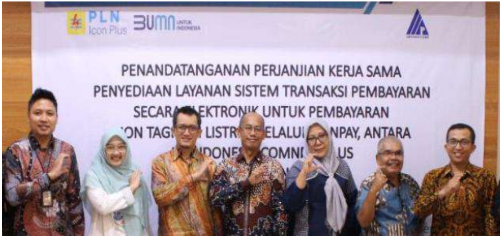
Kabar dari Member Tender Indonesia

PLN Icon Plus SBU Regional Sumatra Bagian Utara (Sumbagut) dan PT Arindo Pratama menandatangani perjanjian kerja sama terkait penyediaan Layanan Sistem Transaksi Pembayaran Non Tagihan Listrika Secara Elektronik melalui ICONPay.