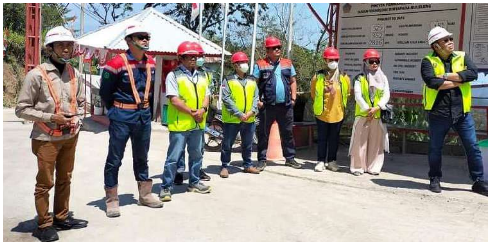
Tim steel structure Tower Turyapada dari PT. Artha Mas Andalan