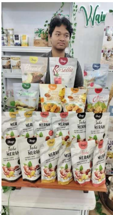
Minuman berbasis jahe