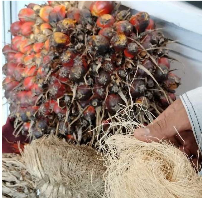
Tandan sawit dipanen, menyisakan limbah, yang kemudian diolah untuk menghasilkan serat.

Ditampilkan juga bagaimana limbah sawit bisa diolah menjadi bahan tekstil dan helm