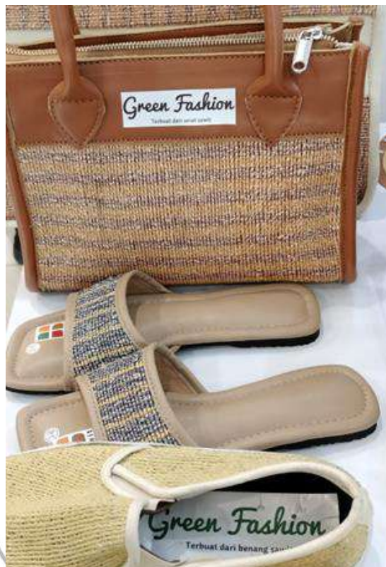
Fashion hasil serta limbah sawit