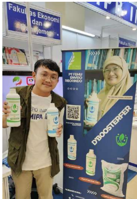
Pupuk organik hayati

Beragam kajian berbagai Pusat Studi pun ditampilkan termasuk mengenai isu penghitungan carbon di sektor kehutanan dan isu penguasaan akan eksplorasi potensi keanekaragaman hayati.