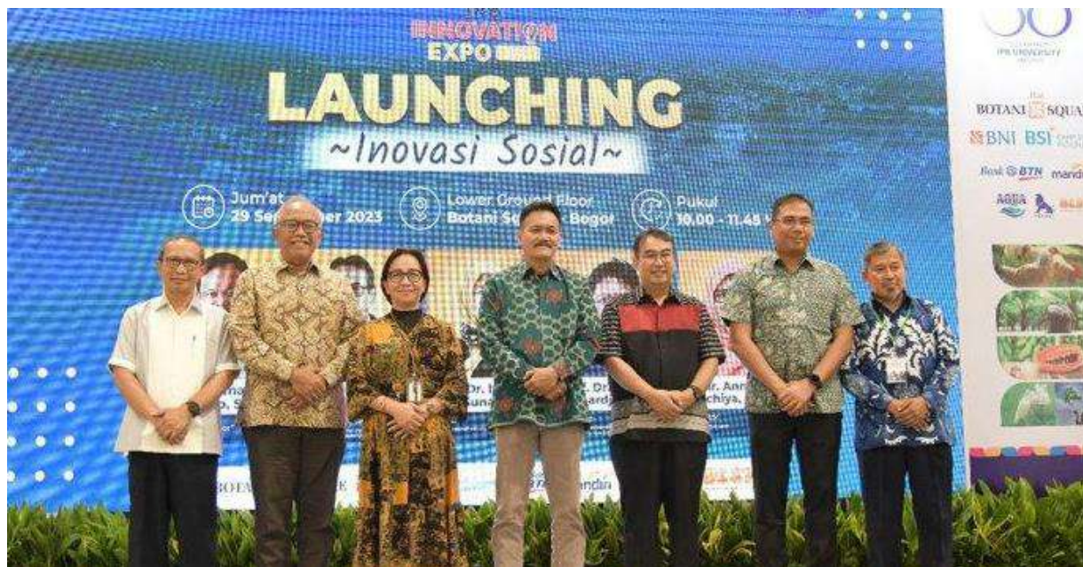
Inovasi IPB University dipamerkan dalam gelaran IPB Innovation Expo 2023 yang berlangsung di Mall Botani Square, Bogor.

Kampus utama di bidang pertanian dan peternakan yaitu IPB, mengadakan expo akan pencapaian inovasi teknologinya nya. Beragam produk maupun jasa unggulan.