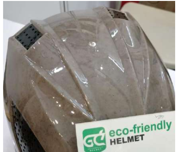
Helm hasil olahan limbah sawit

Ditampilkan juga bagaimana limbah sawit bisa diolah menjadi bahan tekstil dan helm