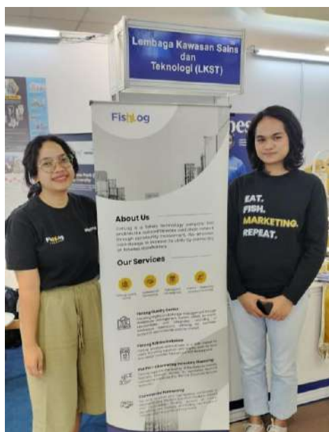
Aplikasi digital untuk pemasaran perikanan tangkap, sekaligus memasarkan infrastruktur perikanan tangkap seperti Cold Chain Services.

Lalu juga beragam pangan hasil inovasi, termasuk produk pupuk organik hayati. Juga dipamerkan beberapa inovasi IPB University seperti varietas cabai dengan kepedasan 100 kali lipat, garam rumput laut, kopi luwak tanpa luwak dan banyak lagi