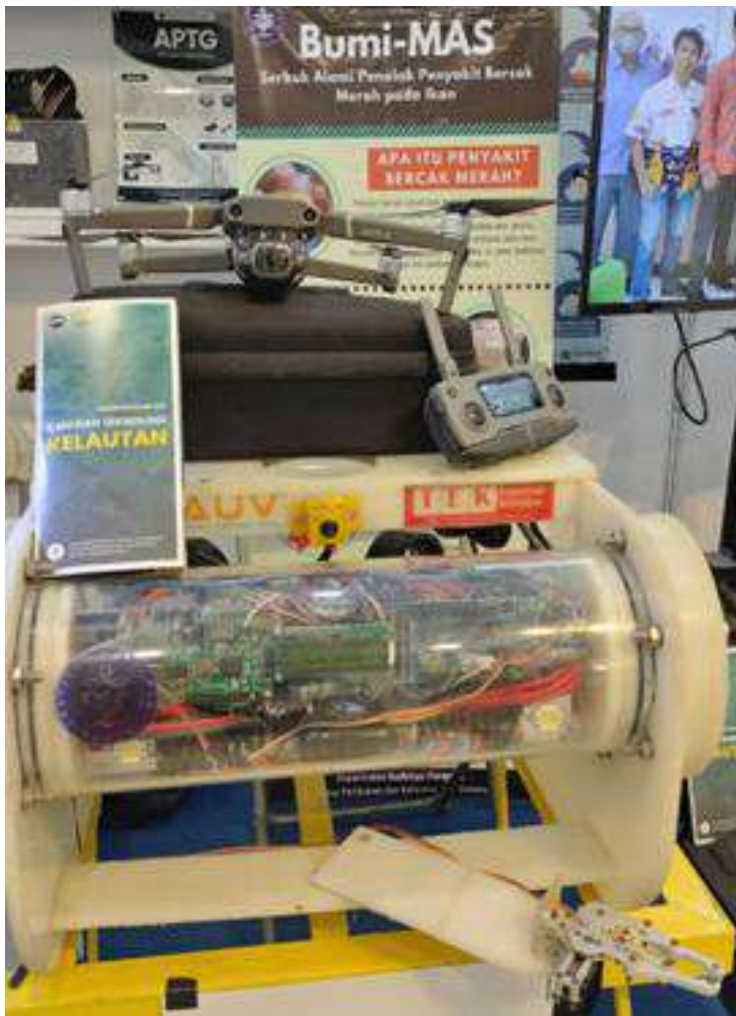
Robot drone bawah air dengan kendali pakai WiFi