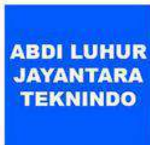
ABDI LUHUR JAYANTARA TEKNINDO