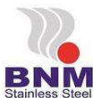
BINA NIAGA MULTIUSAHA